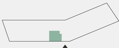
Planta de localização da fração Floor plant location unit