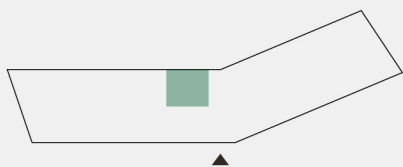
Planta de localização da fração Floor plant location unit