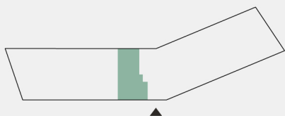
Planta de localização da fração Floor plant location unit