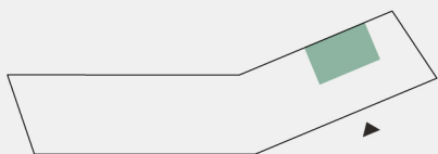
Planta de localização da fração Floor plant location unit