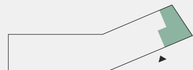
Planta de localização da fração Floor plant location unit